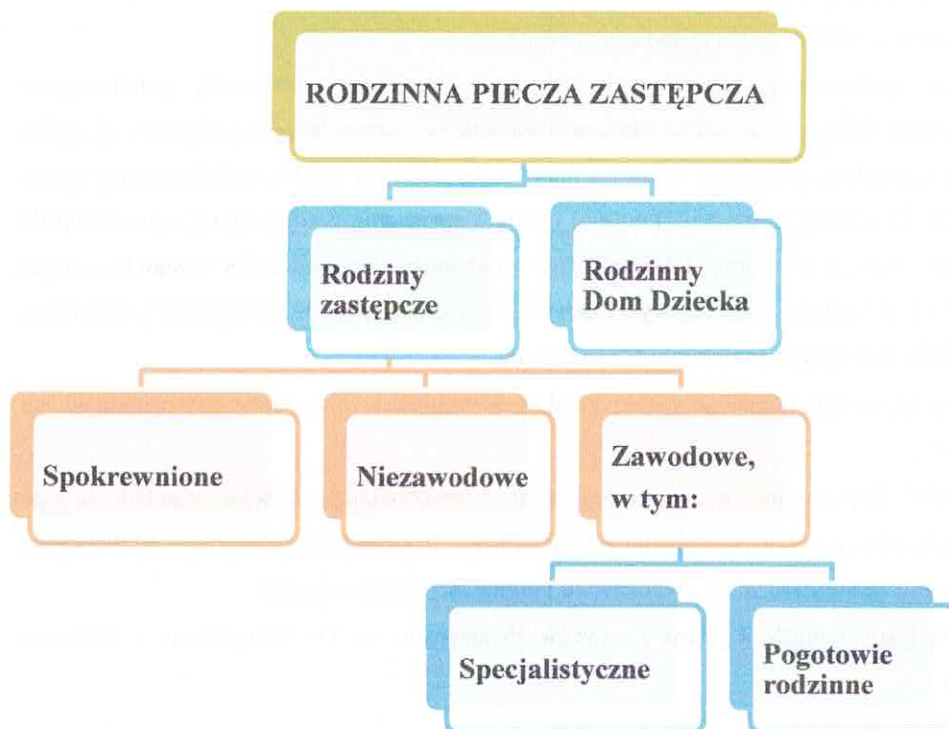
Wykres nr 1. Model rodzinnej pieczy zastępczej.

Rodzinę zastępczą lub rodzinny dom dziecka tworzą małżonkowie lub osoba niepozostająca w związku małżeńskim, u których umieszczono dziecko w celu sprawowania nad nim pieczy zastępczej.